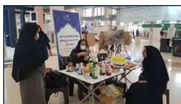
برپایی غرفه دانشگاه در ششمین جشنواره و نمایشگاه ملی گیاهان دارویی، فرآورده‌های طبیعی و طب سنتی ایران ۱۴۰۱/۰۸/۱۰