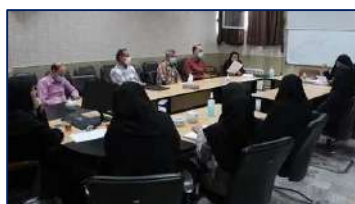
جلسه هماهنگی شورای ارتقای سطح سلامت کارکنان شبکه بهداشت و درمان دامغان ۱۴۰۱/۰۸/۱۱