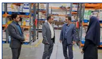
بازدید سرپرست معاونت غذا و دارو دانشگاه از شرکت پخش دارویی ۱۴۰۱/۰۸/۱۴