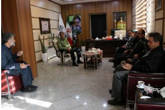
یافته است، بر بهبود شرایط با توجه به سیاست های جدید سازمان غذا و دارو تاکید کردند.

تامین داروهای مورد نیاز مردم از سوی شرکت ها و توزیع به موقع بر اساس سهمیه استانی تاکید و بیان کرد: همکاری و تعامل شرکت های دارو با حوزه سلامت و رعایت دستور عمل های ابلاغی توزیع دارو نقش موثری در رفع کمبود دارو در استان را دارد. معاون غذا و دارو دانشگاه نیز ضمن اعلام سیاست های جدید سازمان غذا و دارو و تعهد مدیریتی جدید برای کاهش کمبودهای دارویی، از رفع کمبودهای آنتی بیوتیک خوراکی، سرم و داروهای مرتبط با آنفلوآنزاهای فصلی در آذر ماه سال جاری خبر داد. در ادامه نمایندگان انجمن های داروسازان، شرکت های توزیع دارو و سازمان نظام پزشکی با بیان اینکه مشکل کمبود دارو به ماه اخیر، کاهش