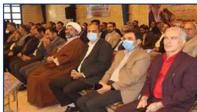
آغاز به کار رزمایش فاطمی ۲ در شهرستان دامغان و ارائه خدمات بهداشتی و درمانی در مناطق محروم ۱۴۰۱/۰۸/۲۸