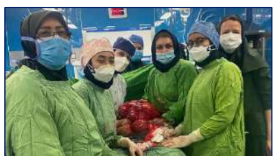
خروج کیست ۵,۵ کیلوگرمی از شکم زن باردار در بیمارستان امیرالمونین(ع) ۱۴۰۱/۰۸/۲۸