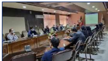
کمیته بیماریهای مشترک انسان و حیوان در مرکز بهداشت شهرستان سمنان برگزار شد ۱۴۰۱/۰۸/۱۰