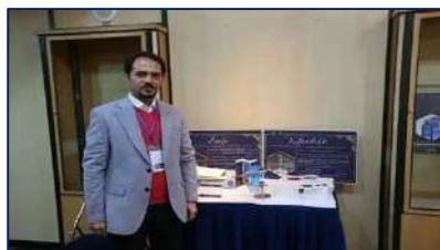
حضور فعال شرکت فناور دانشگاه در نمایشگاه تخصصی دستاوردها و فناوری‌های حوزه سلامت مجلس شورای اسلامی ۱۴۰۱/۰۸/۲۹