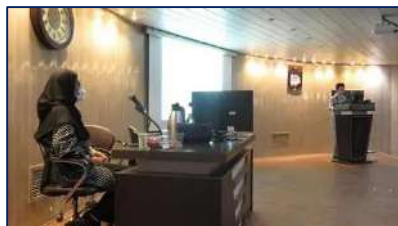
برگزاری سمینار قند و پند ۲ با حضور بیماران دیابتی در مرکز آموزشی، پژوهشی و درمانی کوثر ۱۴۰۱/۰۸/۲۸