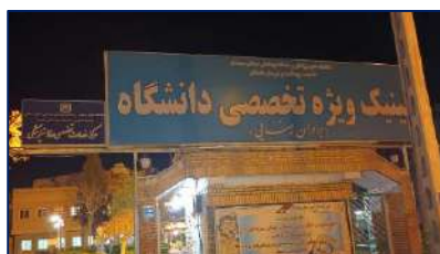
سرپرست بیمارستان ولایت: در حال حاضر ۴ پزشک متخصص زنان در دامغان مشغول خدمت هستند ۱۴۰۱/۰۸/۳۰