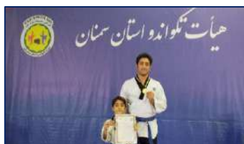
درخشش پدر و پسر خانواده دانشگاه در مسابقات تکواندو ۱۴۰۱/۰۸/۱۷